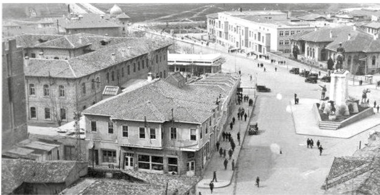
1940'lı yıllarda Ankara...

Ben mi hatırlıyorum yoksa bana anlatılanlardan mı biliyorum, orası muğlak. Tek başına tuvalete gitmeye kalkmışım, benden ses seda gelmeyince merak etmişler. Bir de bakmışlar ki başım kuburum içinde, amuda kalkmış vaziyette duruyorum. O günden beri de başım boktan kurtulmadı gitti!