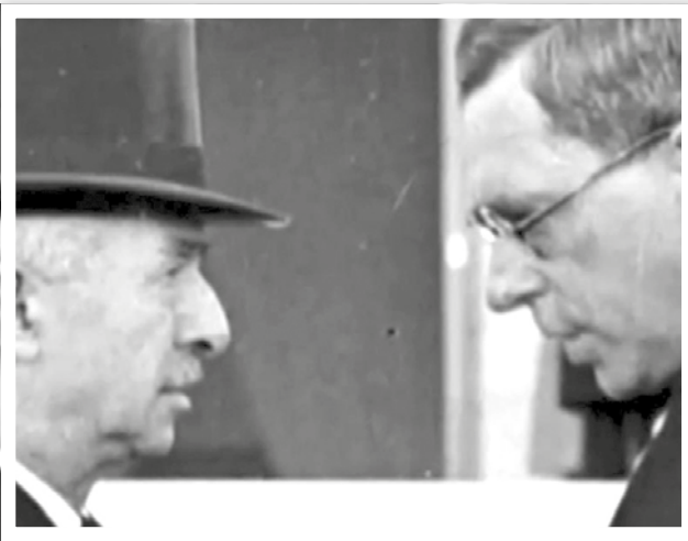
İsmet İnönü ve Nevzat Tandoğan.