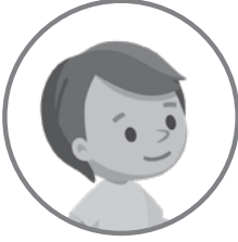
Çocuk: Uras 2 yaş