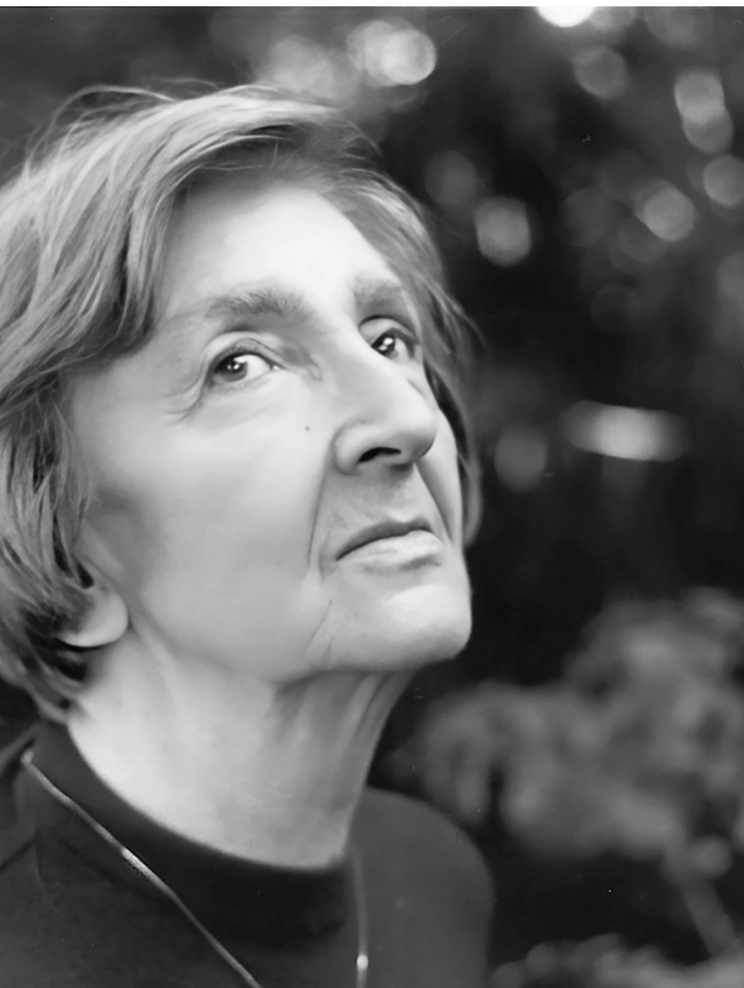
Tiraje, 1991