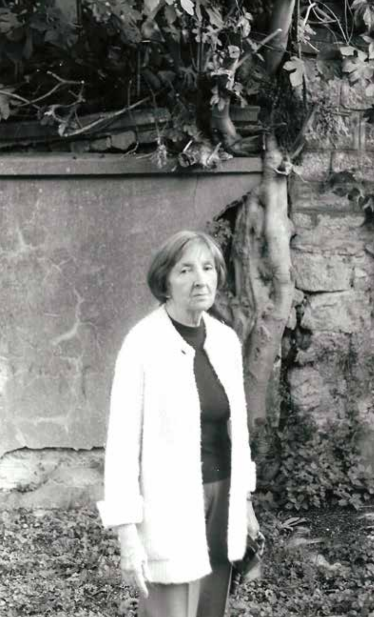
2003, B y kada turunda, Fotoğraf: NS