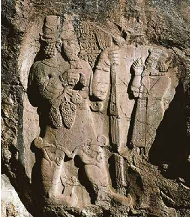
Kral Varpalavas ile bolluk bereket tanrısı Tarhundas.

nın geniş bir sahasına yayılmış olmasıdır. Batı uygarlıklarının zaruri maddi değerleri ekmek, şarap ve paradır. İlginçtir ki her üçünün kökeni de Anadolu'dur. Hıristiyanlıkta şarap ve ekmeğin kutsanması da buradan gelir. Anadolu'da asma tarımıyla ilgili pek çok kabartma vardır ve kilise duvarları da şarap üretimini anlatan fresklerle bezenmiştir. Örneğin, MÖ 727-742 yılları arasında, Kral Varpalavas tarafından yapıldığı tahmin edilen ve tarihteki bilinen ilk yazılı tarım anıtı kabul edilen Konya İvriz'deki kabartmada, Kral Varpalavas ile elinde başaklar ve üzüm salkımı tutan bolluk bereket tanrısı Tarhundas'ı görürüz.