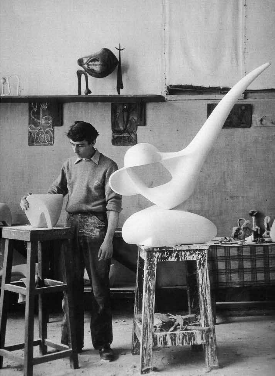
Koman, Rue de la Grande Chaumière'deki atölyesinde, Paris 1949. (Sağ taraftaki alçı heykel 1949'da Salon des Réalités Nouvelles'de sergilendi.)