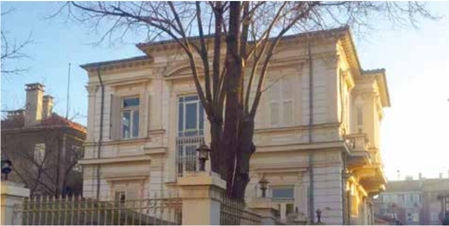
Komanların Edirne'deki evleri, 2017