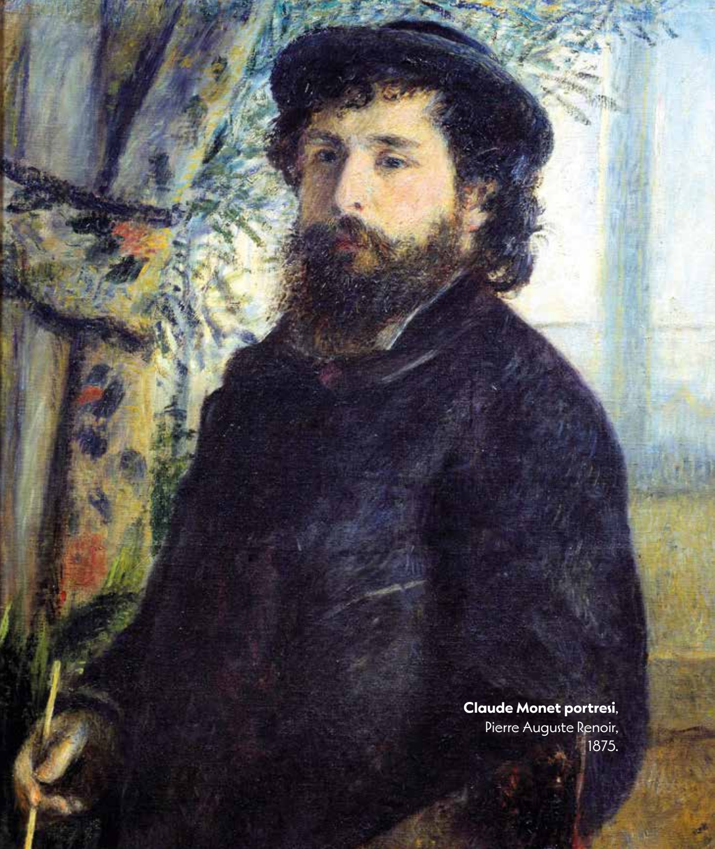
Claude Monet portresi, Pierre Auguste Renoir, 1875.