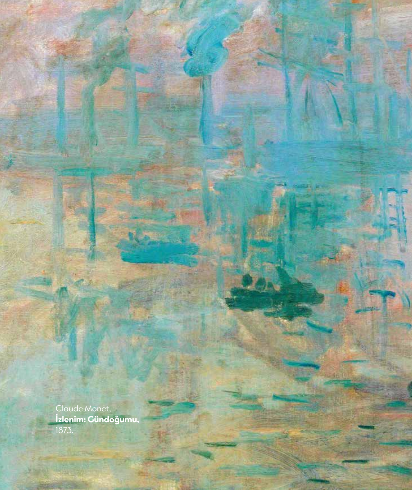
Claude Monet, İzlenim: Gündoğumu, 1873.